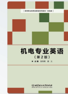
机电专业英语 (第2版) 978-7-5682-2788-9 别传真 39.00元